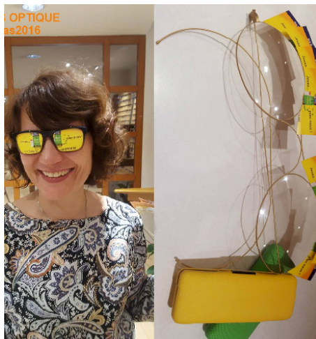
Opération « A deux pas »