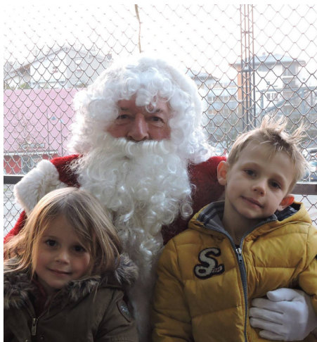
Opération de Noël