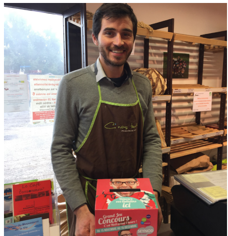
Opération de Noël