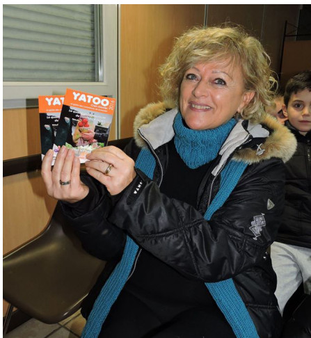
Guide « Yatoo »