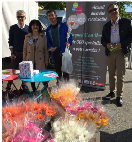
Opération Fête des mères