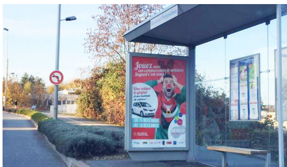
Opération de Noël