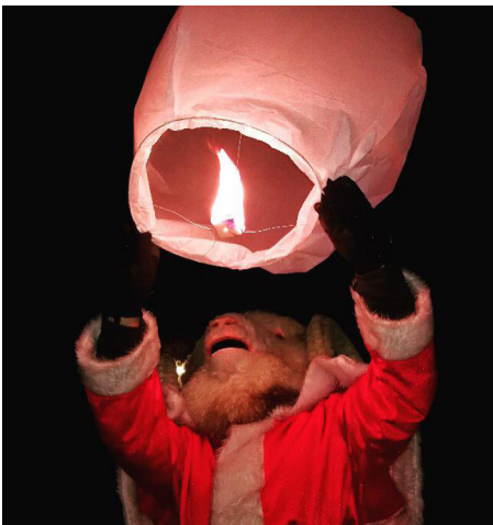
Opération de Noël