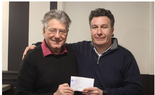
Opération Resto du Coeur