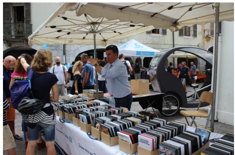
Le grand déballage