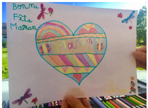
Opération Fête des mères